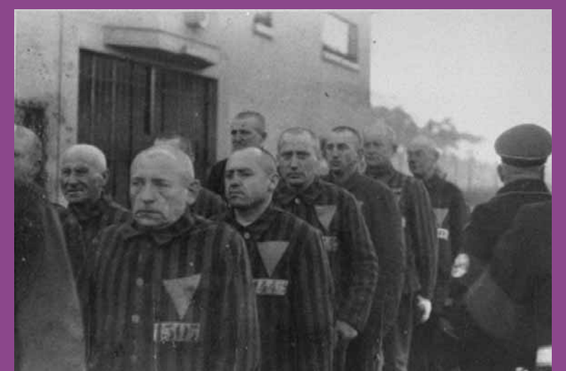
DÉPORTÉS HOMOSEXUELS DANS LE CAMPS DE SACHSENHAUSEN

RENAUD - «P'TIT PÉDÉ» ZAZIE - «ADAM ET YVES» PLACEBO - «MY SWEET PRINCE» PLACEBO - «NANCY BOY» LARA FABIAN - «LA DIFFÉRENCE» AXEL RED - «UN HOMME OU UNE FEMME»