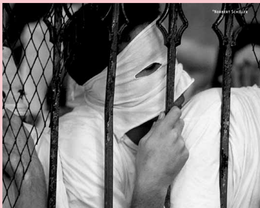
EGYPTE : 23 HOMMES ONT ÉTÉ CONDAMNÉS POUR HOMOSEXUALITÉ EN EGYPTE

ABONNE-TOI GRATUITEMENT À LA NEWSLETTER D'AMNESTY SUR LES DROITS DES PERSONNES LGBT (LESBIENNES, GAY, BISEXUELLES ET TRANSSEXUELLES). CHAQUE MOIS, CETTE NEWSLETTER ÉLECTRONIQUE TE PROPOSE DES MOYENS D'AGIR SUR DES CAS SPÉCIFIQUES DE PERSONNES HOMOSEXUELLES OU D'AGIR PLUS GLOBALEMENT POUR LA DÉFENSE DES DROITS DES PERSONNES HOMOSEXUELLES PARTOUT DANS LE MONDE. POUR RECEVOIR CE COURRIER ÉLECTRONIQUE, IL TE SUFFIT DE T'INSCRIRE À LA MAILING LIST À L'ADRESSE SUIVANTE: HTTP://WWW.AMNESTYINTERNATIONAL.BE/DOC/RUBRIQUE87.HTML